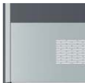
panou inferior de ventilație