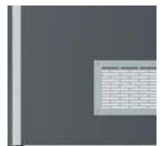
grilă de ventilație