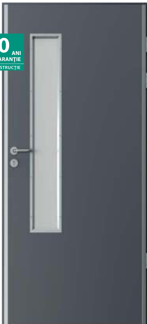
ENDURO 3, Antracit