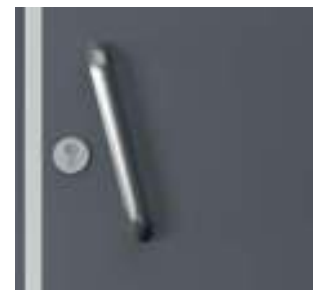
mâner pentru o parte