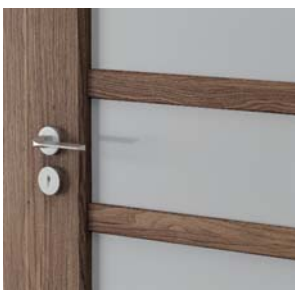
ramă cu sticlă