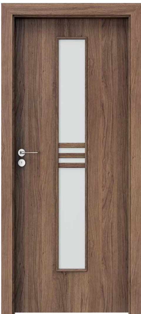
Porta STIL 1, Stejar California