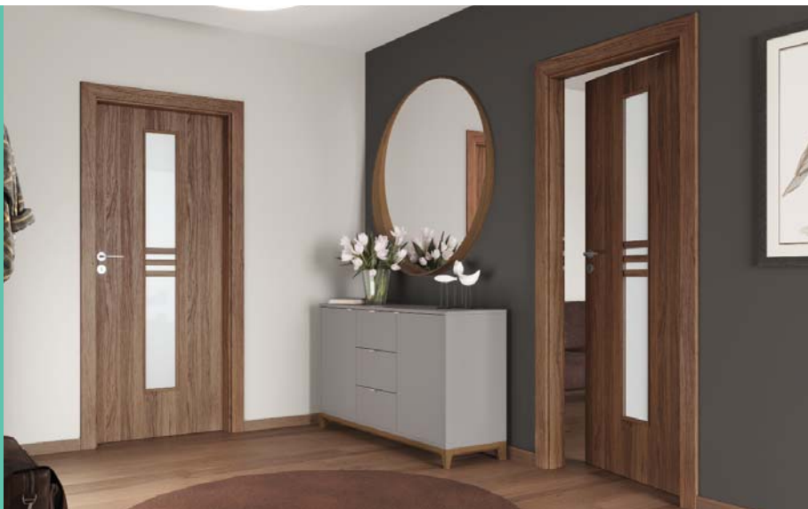
Porta STIL 1, Stejar California