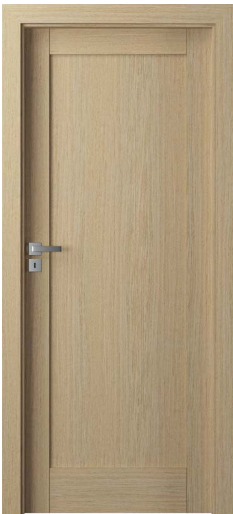
Natura GRANDE A.0, Stejar