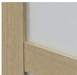
ramă cu sticlă