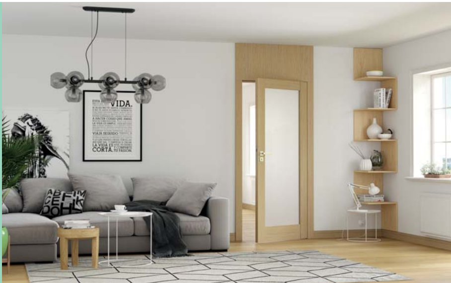
Natura GRANDE A.1, Stejar