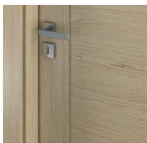
panou plan – model B.0