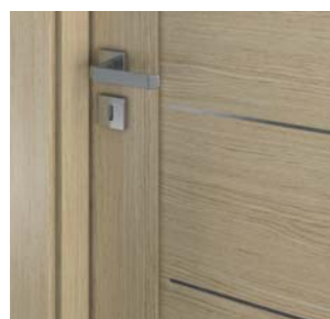
insertii – model D.0