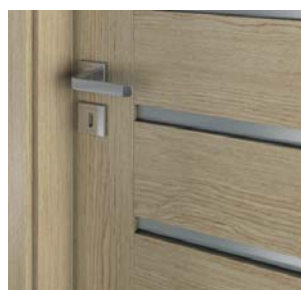
model A.9 - ramă cu sticlă