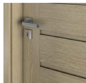
model A.0 - panou plan