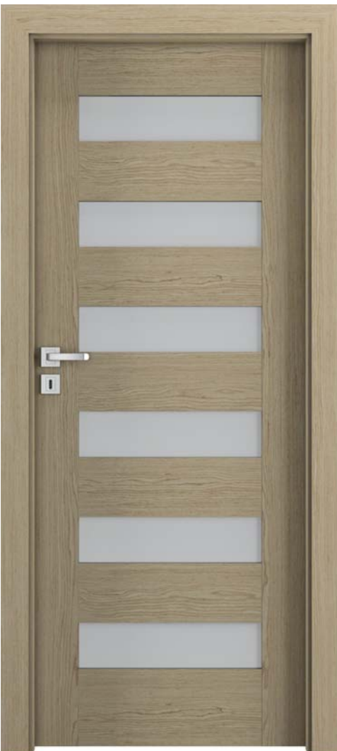
Natura CONCEPT C.6, Stejar