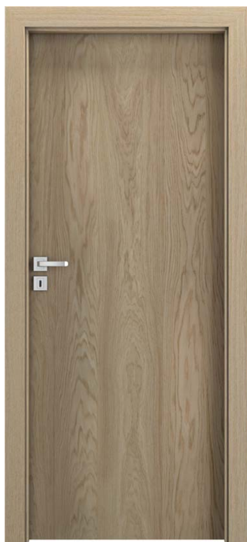
Natura CLASSIC 1.1, Stejar 1, Floare