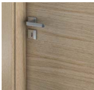
striaiii orizontale (grupa 7)