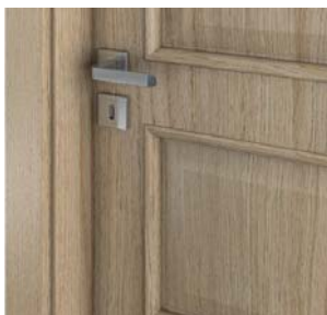
ramă ornamentală (grupa 5)