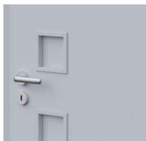
ramă cu panou – pe finisajul CPL profilul ramei este rotunjit