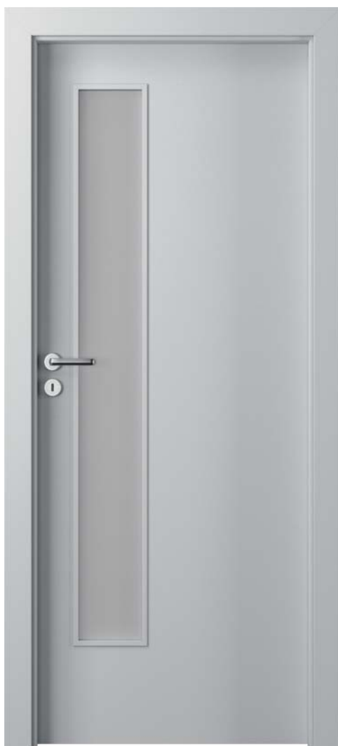
Porta FIT I.1, Gri Euroinvest