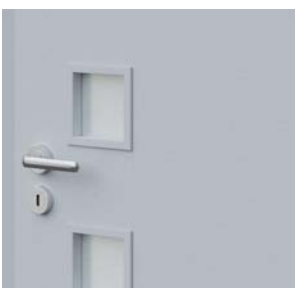
ramă cu sticlă – pe finisajul CPL profilul ramei este rotunjit