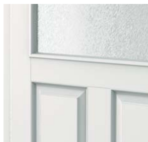
finisaj structură netedă ***

** Finisajul structură granulară este disponibil pentru colecțiile Londra și Viena.