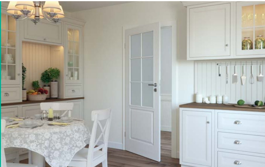
VIENA B, Alb