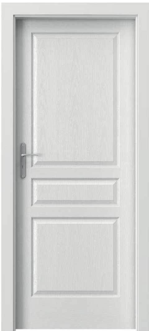
VIENA P, Alb