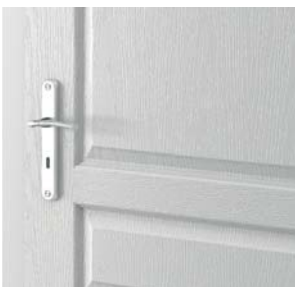
LONDRA, VIENA finisaj structură granulară**