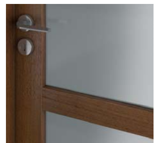
TOLEDO ramă cu profil 20°