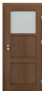
CORDOBA geam mic