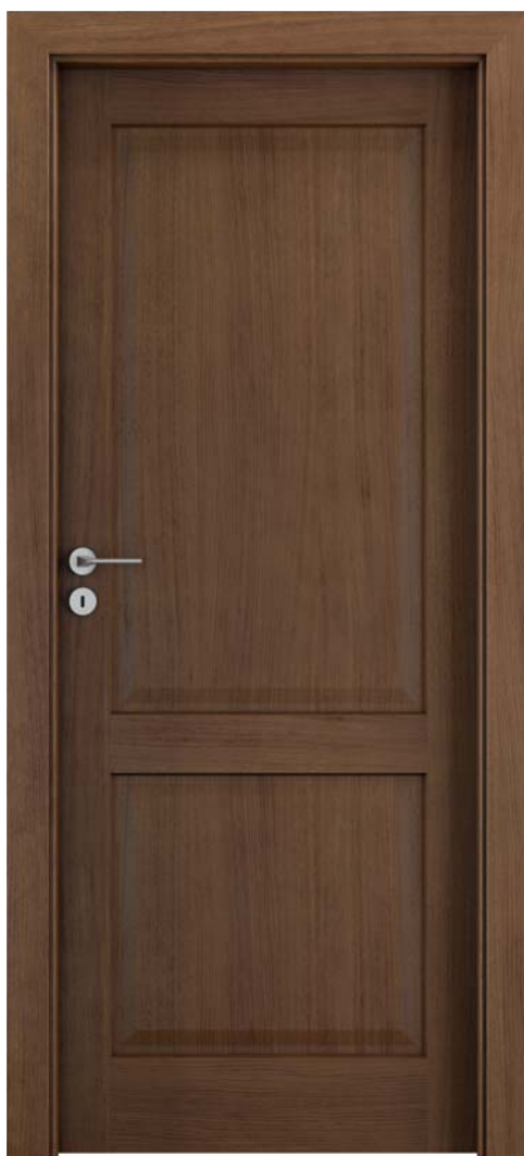
CCORDOBA plină, Tabacco