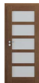
TOLEDO model 5