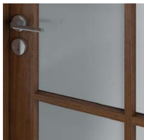
CORDOBA ramă cu profil 20°