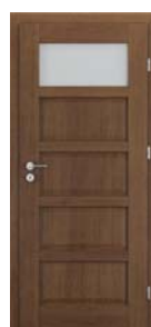
TOLEDO model 1