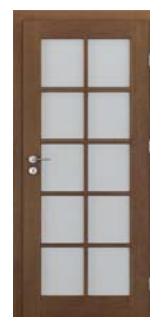
CORDOBA grilă mare