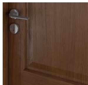
CORDOBA panou cu profil simplu