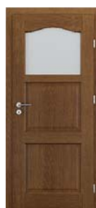
MADRID geam mic