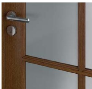
MADRID ramă ornamentală special profilată