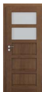
TOLEDO model 2