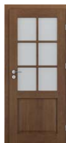
CORDOBA grilă mică