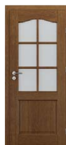
MADRID grilă mică