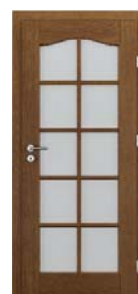
MADRID grilă mare