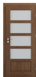
TOLEDO model 4